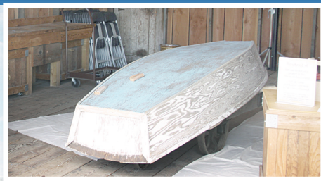
▲在列治文航海節中,將有各式船隻供民眾登船參觀。小圖為造船廠內部,民眾可體驗19世紀造船方法。

每年一度的列市航海節已是第7年舉行,舉行地點的布瑞坦尼亞船廠,建於1880年,以生產木製漁船為主,船廠四周有許多仿古建築,包括早期華裔和日裔移民的民宅和船塢,都是依據史料在原址重建,活動攤位中更有人示範19世紀的造船方法,令參觀民眾恍如步入時光隧道。