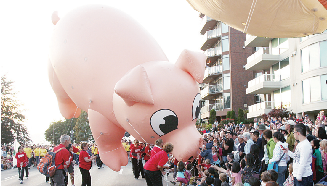
▲兩層樓高的豬小姐頻與路人親吻。 ▼PNE 小姐的名字仍有不少人記得。