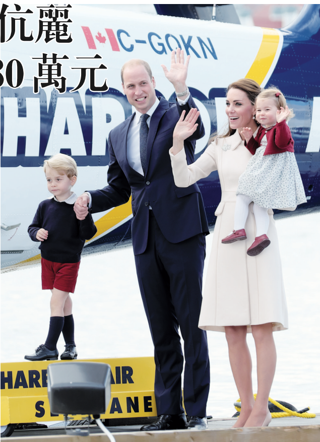
威廉王子一家去年訪卑詩，離開時與群眾揮手道別。

聯邦政府尚未公布最後花費金額，但以政府預算數字85.56萬元計算，連同育空地區公布的42.9萬、卑詩省府的61.3萬和皇家騎警日前公布的約200萬，總開銷料逾380萬元。