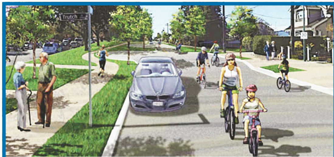
市府計劃將灰角路一段改為只有住社區居民才能進出。