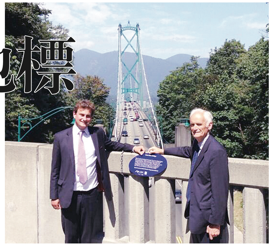
吉尼斯家族的兩名成員為獅門橋添上「重要地標」藍色名牌。

金會邀請公眾提名一些對溫市十分重要的，但未獲正式肯定的地方、人物或活動，然後再由本地歷史學家、藝術家及學生等組成的獨立委員會共同選出125項。基金會會在這些重要地方掛上藍色名牌，以確認它們的重要地位，而每塊名牌上，亦加入手機條碼（QR Code），遊人只要用手機掃描條碼，便可連接到基金會的網頁，取得計劃的詳情及該項「重要地標」的背景資料。