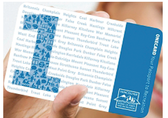
持「一卡通」可以使用不同公園局設施。

目前「一卡通」持有者可以憑卡使用公園局營運的23個設施。而在9月1日起，「一卡通」將適用於全市整個娛樂網絡，包括社區中心。