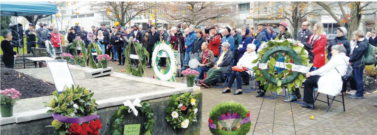
▼ 首屆紀念活動約有百餘名大溫各界代表出席。