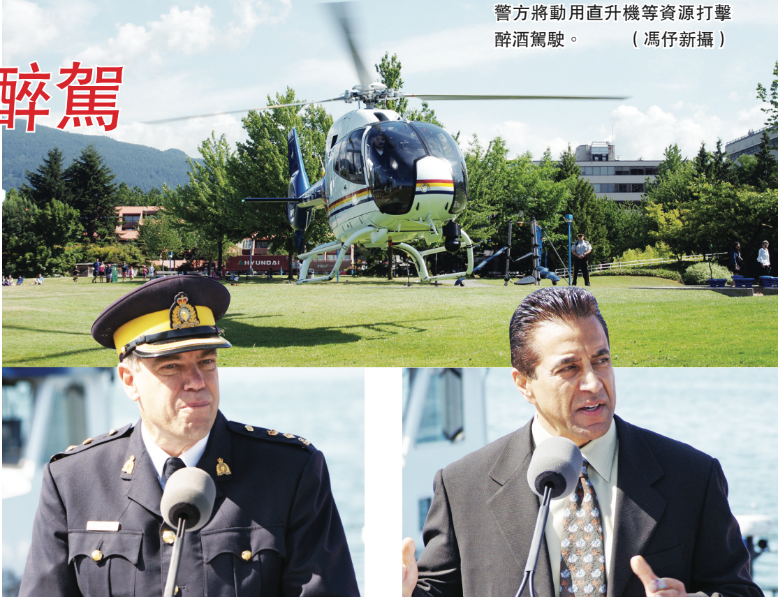
警方將動用直升機等資源打擊醉酒駕駛。

皇家騎警卑詩分部交通部門警司高蒙特(Norm Gaumont)強調，這個暑假警方將動用直升機等所有可能的資源，來嚴打醉酒駕駛。如果抓到續犯，更會執行扣押汽車的法令，並