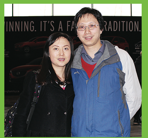
董先生(右)與妻子一家來車展，主要為滿足兒子好奇心。