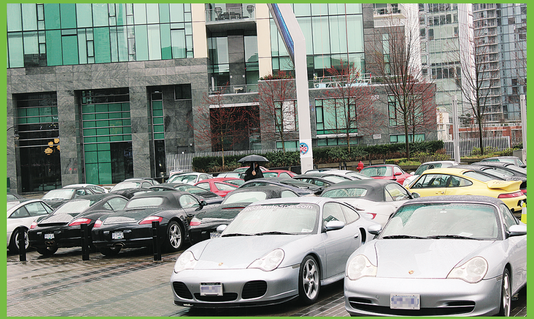
保時捷車主俱樂部將50多部保時捷開到會場外，聲勢浩大。