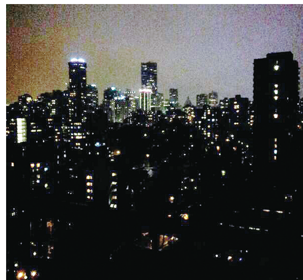
卑詩省今年的「地球一小時」節電僅為去年的一半，為7年最低。圖為溫市中心前日響應「地球一小時」關燈景象。(資料圖片)

昨日則向傳媒發出聲明，解釋市府工程人員雖然在該處辦公，但該大樓卻是由私人公司管理，關燈與否並不是市府所能控制，而市府大樓當時便有關燈。