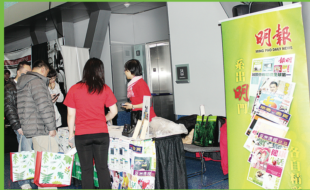
《明報》在車展上設立活動攤位，受到市民歡迎。