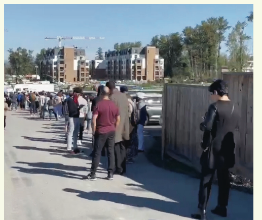
蘭里一個新的樓花單位，昨日吸引許多買家排隊。(網上照片)里樓花的呎價有可能會上漲至800元，緊追素里的樓花價格。

她表示，不少買家及經紀同業都說，看好蘭里樓花未來前景的原因是，當地即將建有架空列車站，這讓交通比較不方便的蘭里，很快可以趕上素里。她說，不少人認為，蘭