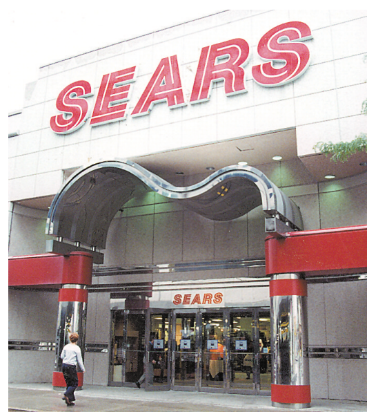
小股東指 Sears 看中加拿大 Sears 所持有的逾 10 億元儲備。

受消息影響，Sears 昨天收報 122.01 美元，上升 9.12 美元，或 8.08%；加拿大 Sears 在多市則收報 29 加元，下跌 0.52 加元，或 1.76%。