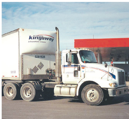
圖為 TransForce 經營的貨櫃車。