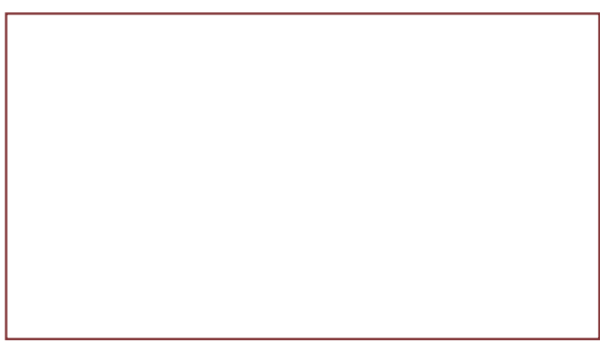
【明報專訊】運輸聯網董事局通過利用加拿大城鎮聯盟的撥款，研究一項車站汽車試驗計劃 (Station Car Pilot Program, 上圖)，希望鼓勵那些在人口密度低的地方工作或居住的人，多使用公共交通工具，毋須刻意添置多一部汽車，造成浪費。

這個車站汽車試驗計劃的構思源自美國和歐洲，以德國鐵路為例，目前在柏林和法蘭克福就有近七百部車站汽車投入服務，年底可能增至一千五百部。根據此等國家的成功經驗，乘客只需繳付月費，便可使用該等汽車來往車站與居所或辦公室，甚至前往購物，毋須特別為交通接駁問題花大筆金錢買另一部汽車。