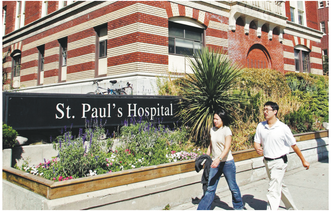
溫市議會將表決是否向聖保祿醫院撥出100萬元興建臨時精神健康中心。

市府表示，臨時精神健康中心可減輕醫院其他部門的工作負擔，同時能提高對精神病患者的服務質素，減低病人需要再送返醫院的機會。另外該中心將以組合屋的形式興建，方便日後重新規劃，改建為其他用途。