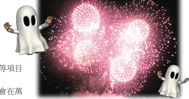
列市居民今年可過一個「煙花萬聖節」。

列市皇家騎警發言人稱，警方將會在萬聖節加派人手在學校、街道、海邊、公園等巡邏，確保市民不會違法燃放煙花，警方為保市民及社區的安全，將會嚴懲違法人士。發言人又說，根據市政條例，任何人非法藏有或展示煙花，或非法出售煙花，將會被罰款 1000 元；非法燃放煙花將罰款 250 元；燃放煙花導致他人身體受傷或財