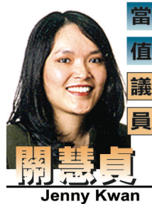
當值議員 關慧貞 Jenny Kwan