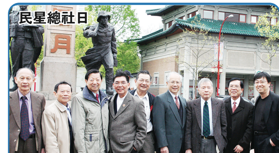
為慶祝民星總社成立85周年，溫市府將今年4月24日定為「民星總社日」，總社並於當日在華埠舉行慶祝晚會。民星總社創立於1925年，是首批按《卑詩社團法》(BC Societies Act)成立的華裔加入非牟利協會之一，致力為受1923年《排華法》和人頭稅影響的華裔提供支援服務。圖為社員於華埠合影。

【明報專訊】卑詩省亞氏症協會定於5月15日及5月22日上午9時半至下午4時半免費舉辦「腦退化症護理系列訓練班」(粵語講授)，讓華裔家屬學習最有效的方法來護理亞氏癡呆症或腦退化症患者。地點：大溫哥華聖約瑟醫院三樓 (3080 Prince Edward St.)，報名或查詢請電604-687-8299林太。