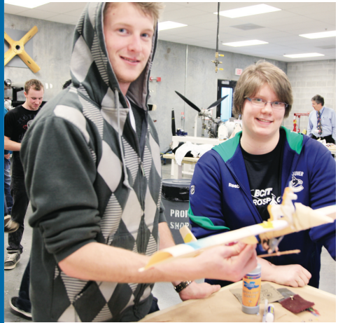
參賽學生稱比賽讓自己認識到要加強基本理論的學習。

學生們設計的飛機中，有傳統式的尖頭三角式、有具現代感的噴氣式、還有創意百出的雙三角形，大家都對自己的設計充滿信心。