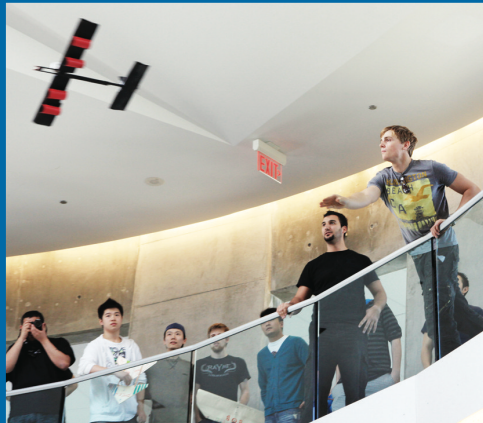
投擲紙飛機的瞬間。

【明報專訊】卑詩理工學院 (BCIT) 昨日舉辦「紙飛機大賽」，來自其航空專業的40多名學生共10多隊選手，用最簡單的材料製成無動力的飛機模型，角逐最佳設計、最有創意、和綜合飛行最遠距離三項大獎，有趣的比賽豐富了學生的航空知識。