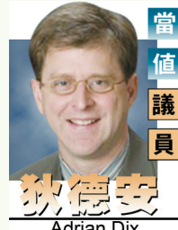
當值議員 狄德安 Adrian Dix