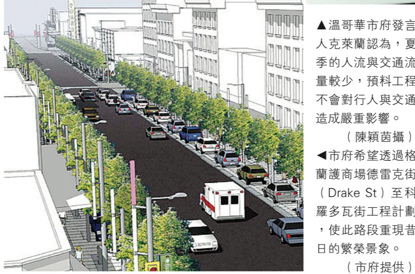
▲溫哥華市府發言人克萊蘭認為，夏季的人流與交通流量較少，預料工程不會對行人與交通造成嚴重影響。 ▲市府希望透過格蘭護商場德雷克街(Blake St.)至科羅多瓦街(Cordova St.)工程計劃，使此路段重現昔日的繁榮景象。