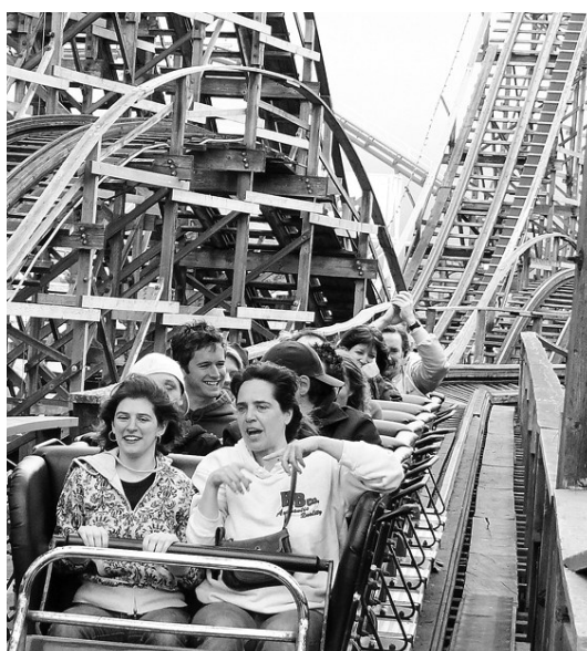
PNE 木製过山车得到國際獎項。(檔案圖片)

木製过山车於1958年開幕，51年來曾經為不計其數的民衆帶來既刺激又歡樂的回憶。