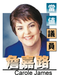
當值議員 詹嘉路 Carole James

溫哥華兩個省議員議席的補選，對省長金寶爾是一個強而有力的訊息。這個訊息反映出有愈來愈多的省民不再被愚弄。