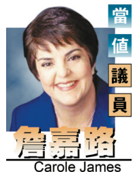
當值議員 詹嘉路 Carole James

溫哥華兩個省議員議席的補選，對省長金寶爾是一個強而有力的訊息。這個訊息反映出有愈來愈多的省民不再被愚弄。