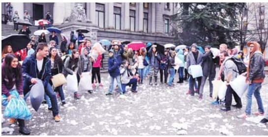
參加者排開陣勢作終極一戰。