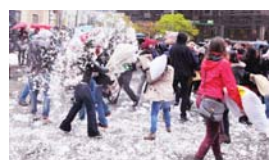
枕頭大戰打致遍地「開花」。

【明報專訊】溫哥華市中心美術館門外昨日下午3時發生「枕頭大戰」，約有50至60名市民參加，吸引大批市民圍觀。參加者興高采烈揮舞手中不同款式枕頭，在雨上進行大混戰，部分單打獨鬥，部分聯群結黨「襲擊」其他人，就算被枕頭痛擊，仍然笑容滿面。