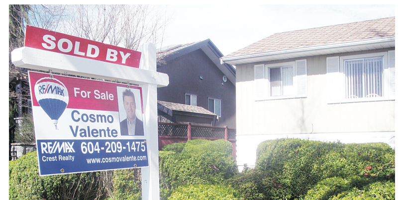
本省上月住宅銷量達7,650間，按年增長18%，銷情是2007年以來最佳的7月份。

穆爾表示，目前處於平衡市場階段，他預計，房價將呈溫和上揚趨勢，但不太可能出現大的變動，而是依通脹率有所提高。