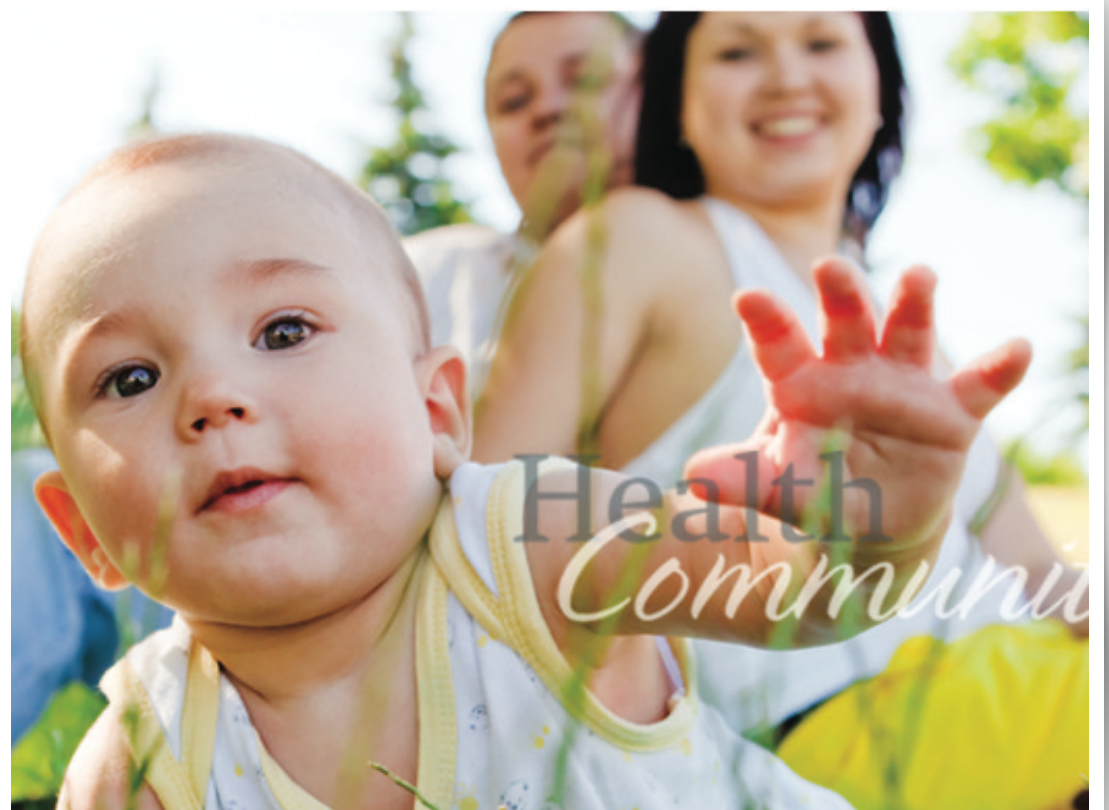
▲「我的健康我的社區」宣傳圖片。