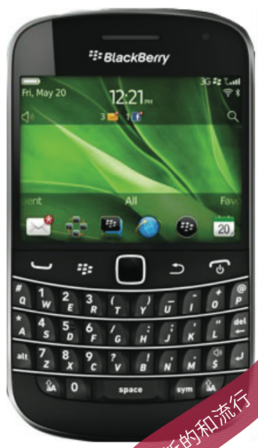
BlackBerry® Bold™ 9900 4G Smartphone

馬上開台！即可節省 $2500！ 只有時代電訊能給您這優惠 優惠期至11月31日2011年