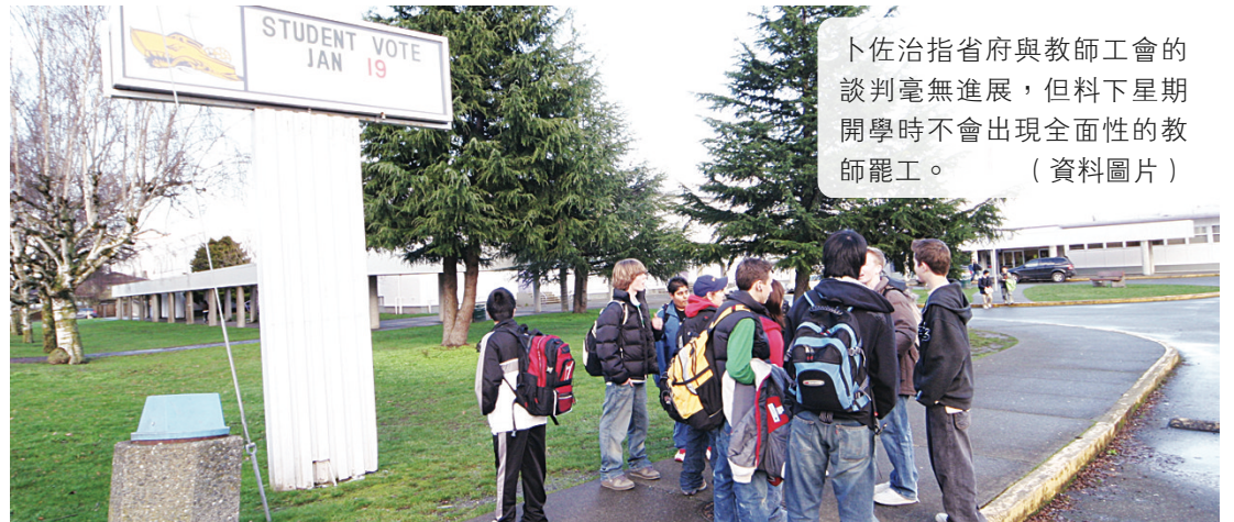
卜佐治指省府與教師工會的談判毫無進展，但料下星期開學時不會出現全面性的教師罷工。

【明報專訊】卑詩省府昨日承認與教師工會的談判毫無進展，認為下星期開學可能發生學校管理層停擺，但不至於出現全面罷工。省府認為今年開學除了有教師罷工陰影外，還有首次出現的全日制幼稚園服務，對省府來說是很大挑戰。