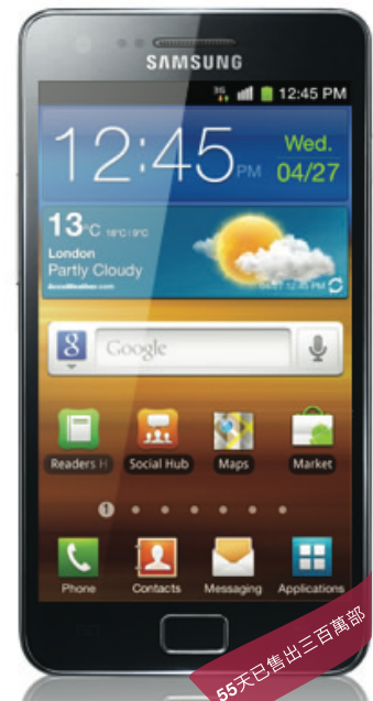
Samsung Galaxy S II™ 4G Superphone