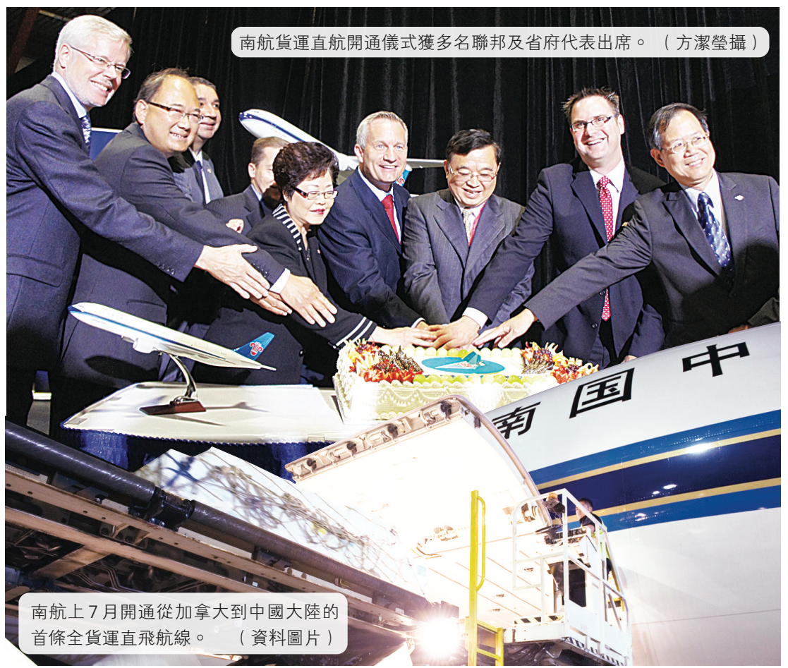
南航貨運直航開通儀式獲多名聯邦及省府代表出席。

海鮮去年的出口額達到9.5億元，其中向中國出口達8000萬元，較2009年增加1200萬元，以前運往中國多經過香港，現在開通直航，相信增長潛力更大。他並提到，希望除了海產，本省的牛肉、櫻桃、藍莓等產品都能更廣泛地進入中國市場。