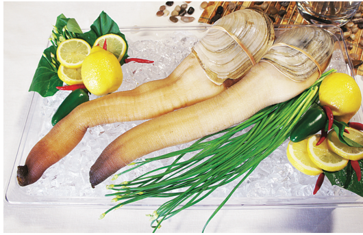
象拔蚌是本省向中國出口的主要海產之一。

海鮮去年的出口額達到9.5億元，其中向中國出口達8000萬元，較2009年增加1200萬元，以前運往中國多經過香港，現在開通直航，相信增長潛力更大。他並提到，希望除了海產，本省的牛肉、櫻桃、藍莓等產品都能更廣泛地進入中國市場。