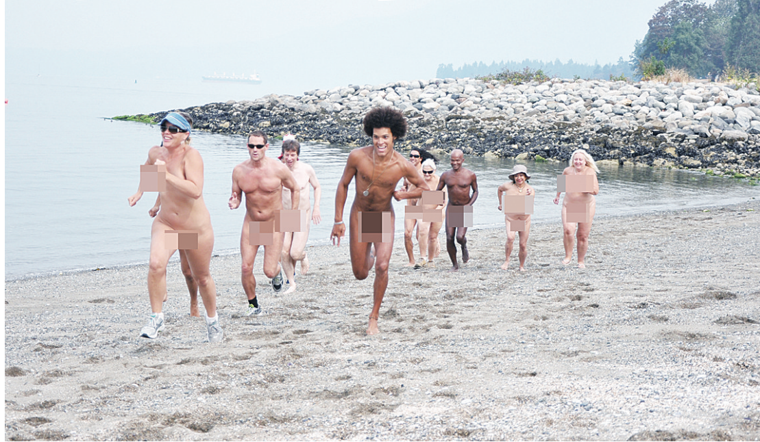
▲10餘位裸體主義者昨早在地日落海灘預跑，為周日比賽做宣傳。

威廉斯指出，裸跑比賽同時亦是讓爛船灣盡可能保持自然本色的一項籌款活動，門票每人25元，16歲以下青少年及60歲以上長者收取20元，有意者可提前在上網到www.wreckbeach.org註冊，亦可當天在比賽開始前直接到海灘購票，所有人都可獲得特別設計的紀念衫一件。