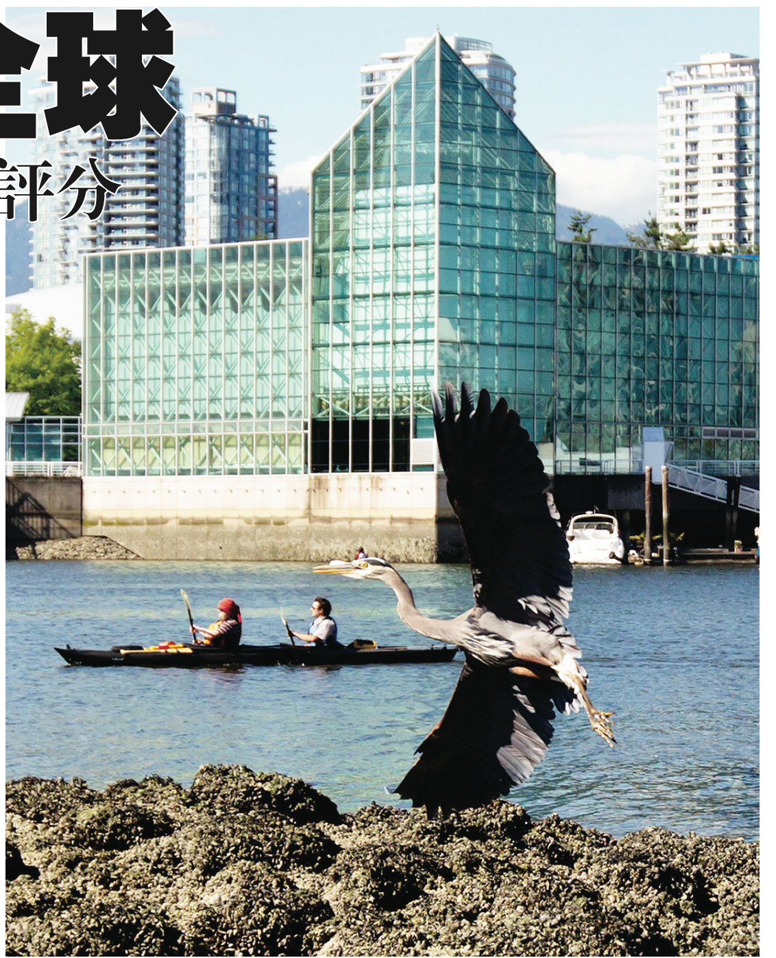
加拿大環境美麗，被評分為最具聲譽國家。

文章作者指，在一些較落後、教育水平較低、失業率長期高企、較貧困的地區，居民壽命會較短。此外，較高的吸煙、酗酒、過胖比率，亦會縮短預期壽命。同時，作者亦指出，兩性之間的壽命差距，在低收入群中尤其明顯。