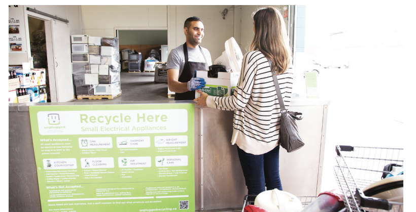
下月1日起將有120種小型家電，被納入可回收物品，屆時民眾購買這些電器需繳付回收費。