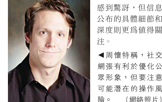
周懷特稱，社交網張有利於優化公眾形象，但要注意可能潛在的操作風險。