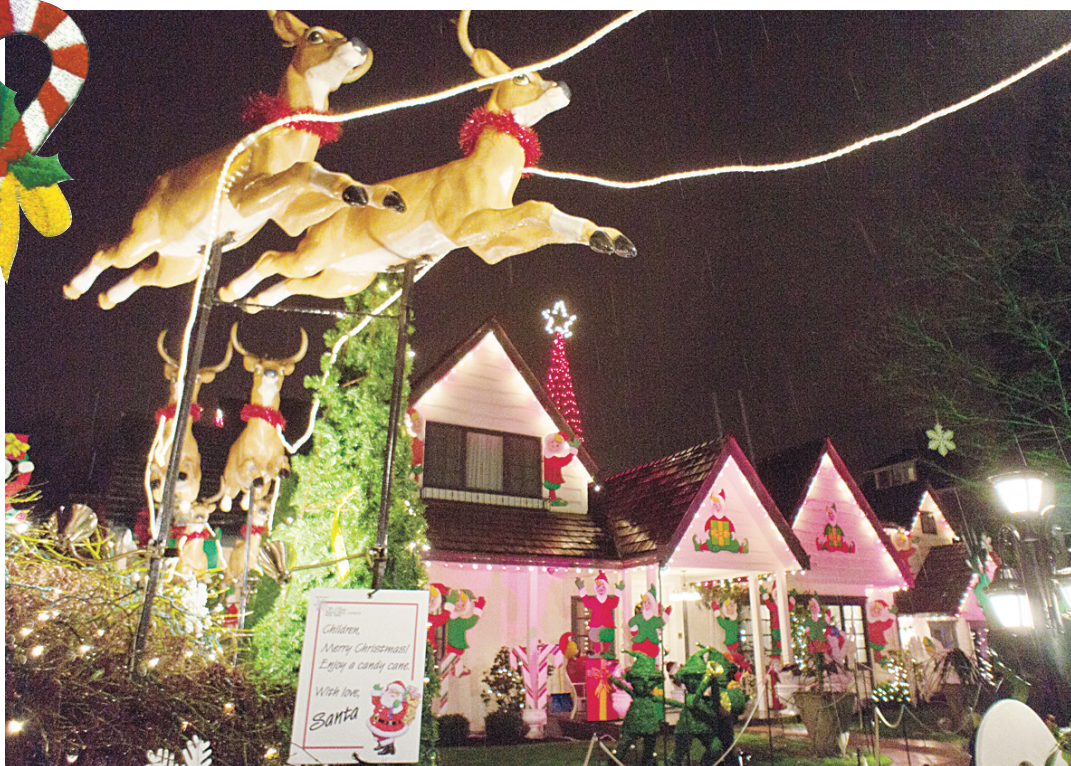
溫哥華 Laurier 路 1412 號的民居燈飾。

聖誕期間，許多市民會絞盡腦汁，將自己的房屋及花園裝上大量聖誕燈飾。如溫東 Trinity 街上的多間民居，便會合力將整條街打造成不輸大型燈會的美景。其餘像 Laurier 路 1412 號、Mathews 路 1690 號、東 1 街 2504 號、東 39