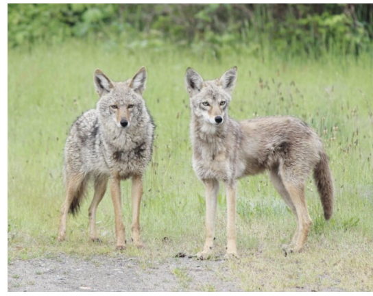
的「鼠兔」取得第二；波因特（James Painter）攝於溫哥華的「大角羊」排第三。

在野外攝影方面，伯吉斯（Steve Burgess）於威士拿（Whistler）攝得的「秋沙鴨一家」勇奪第一；Trevor Haldane於內陸芬尼（Fernie）拍攝