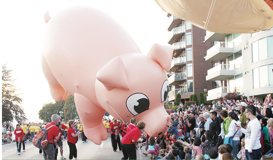
▲兩層樓高的豬小姐頗與路人親吻。 ▼PNE 小姐的名字仍有不少人記得。