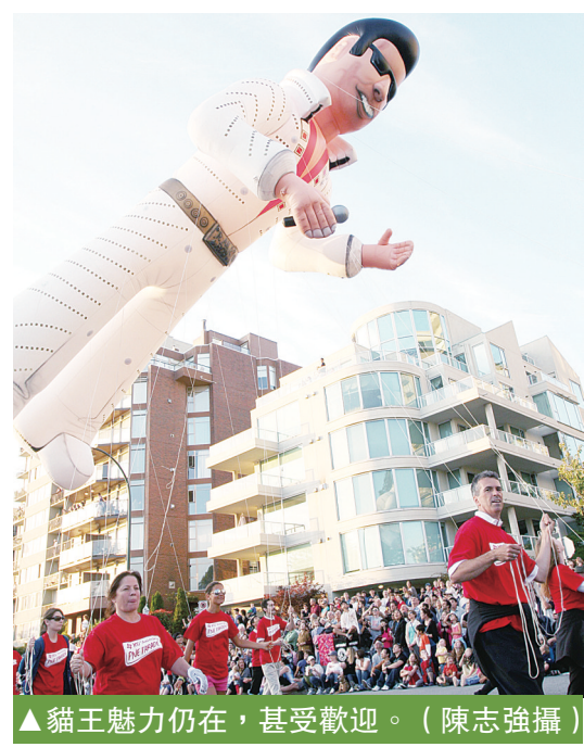
▲貓王魅力仍在，甚受歡迎。