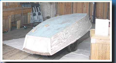
▲在列治文航海節中,將有各式船隻供民眾登船參觀。小圖為造船廠內部,民眾可體驗19世紀造船方法。