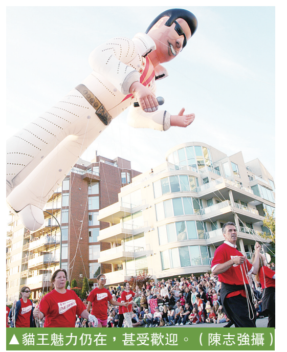
▲貓王魅力仍在，甚受歡迎。