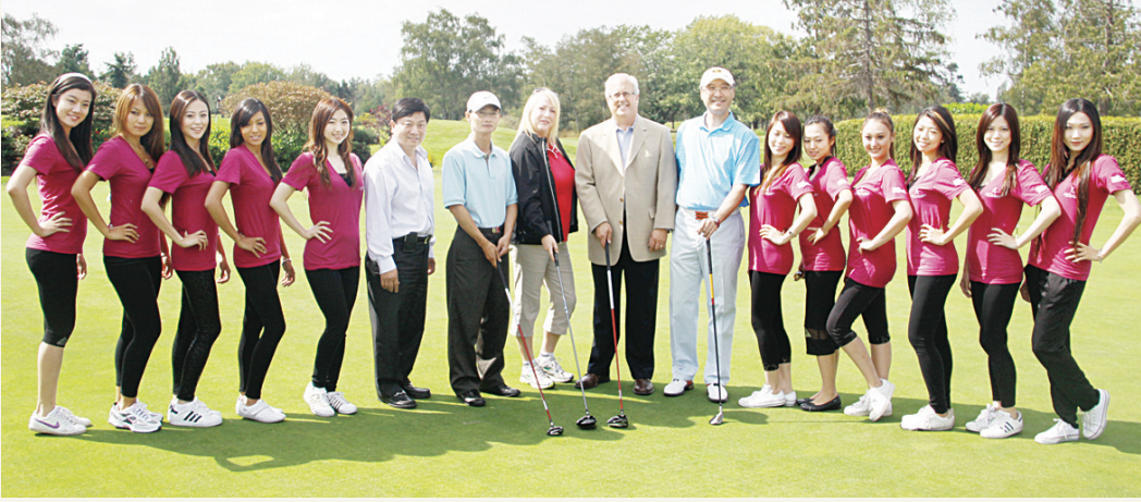
加拿大中國商會和泛太平洋高爾夫球會，昨日於列治文 Quilchena 高球場舉行「慈善高球賽 2010」，為列治文醫院基金會募款添置器材。現場有列市市長馬保定 (Malcolm Brodie, 右8) 主持開球，並有 11 名亞洲小姐的候選佳麗協助籌款。(圖/文: 楊大東)