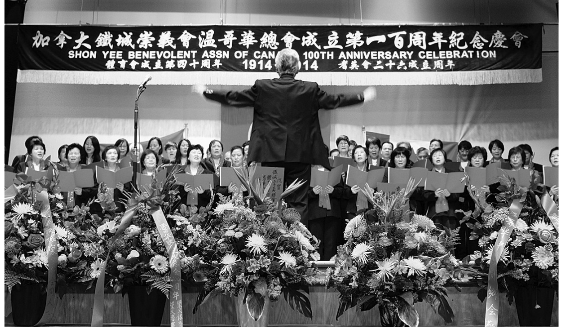
三地會員合唱會歌。

昨日的慶典儀式上，各方代表紛紛祝賀溫哥華總會成立100周年，稱讚總會管理有方，更長年熱心公益、服務社區，多年來為服務大溫地區華人及團結僑社作出不懈努力和貢獻，是本地僑團