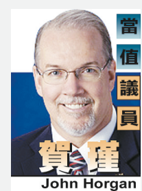
當值議員 賀瑾 John Horgan

隨着夏天即將來臨，本省許多年輕人將開始尋找工作。不論是尋找夏季短期工作，或是高中、專科、大學畢業生投入職場，都將面臨本省艱難的就業市場。