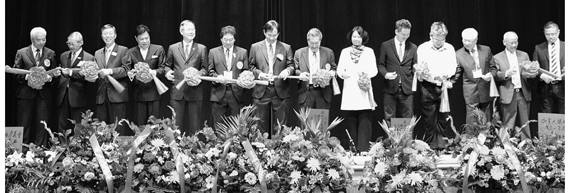
嘉賓為100周年慶典剪彩。