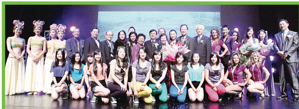
「展家鄉青年才藝，迎新中國63國慶」專場大型宣傳東莞，圖為表演者與嘉賓合攝。

創業協進會舉辦2012西岸晚宴，歡迎各界踴躍參加，日期為10月11日(周四)晚上六時，晚宴於The Fairmont Waterfront Hotel舉行，費用每人150元(連稅)，詳情請聯絡創業協進會報名，電話：905-479-2802或電郵到awards@acce.ca，網址：www.acce.ca。