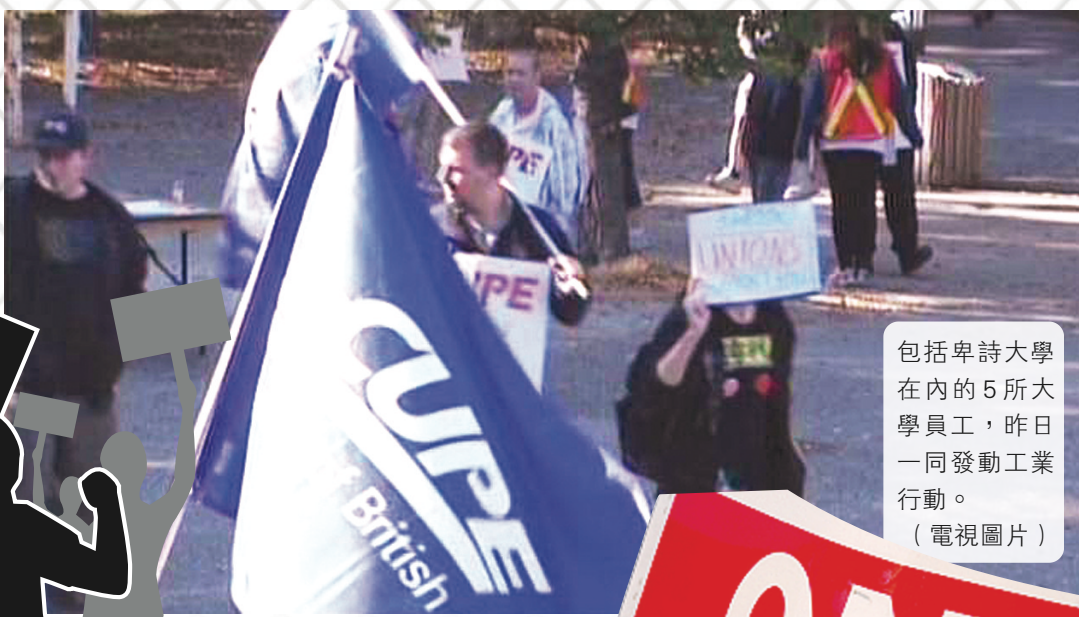
包括卑詩大學在內的5所大學員工，昨日一同發動工業行動。

【明報專訊】卑詩五大知名大學的工會昨日一同發動工業行動，行動成員大部分為教學助理及支援員工，他們各自於校園內設置糾察線包圍建築物，或者按章工作拒絕超時加班，其中北卑詩大學(UNBC)更一度在形式上「封鎖」校園達3小時，但實際上沒有阻止其他人出入。