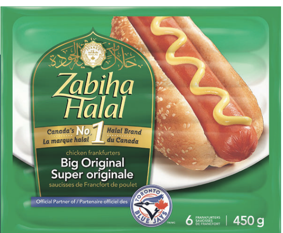
▲受回收令影響的兩款香腸。