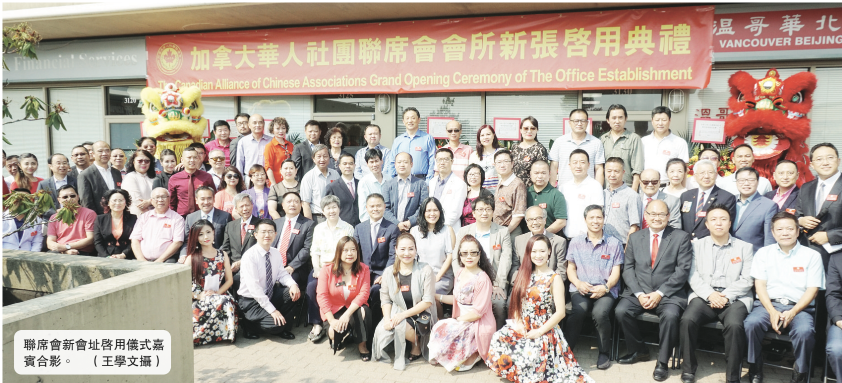
聯席會新會址啓用儀式嘉賓合影。