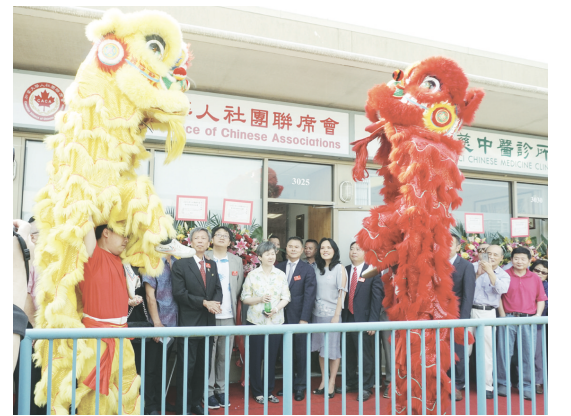
剪綵儀式在醒獅表演中開始。

【明報專訊】加拿大華人社團聯席會昨日在列治文太古廣場三樓舉行新會址啓用儀式。這是聯席會自2008年成立以來，首次自置會所物業，全部30多萬元皆由籌款所得。加拿大三級政府及中國駐溫哥華總領館皆派代表參加並表示祝賀。