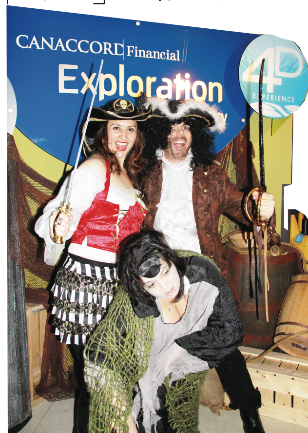
▲工作人員扮成海盜與小朋友同樂，萬聖節氣氛十足。同時特備海洋動物骨骼展。

【明報專訊】溫哥華水族館從明日起至31日，將舉行 Spooky Seas 萬聖節特展。活動期間館內將佈置如同鬼屋一樣，展示各種海洋生物骨骼，並放映特製的萬聖節4D電影，打扮成海盜的解說員還將與小朋友分享卑詩沿海的沉船鬼故事，非常適合親子同樂。