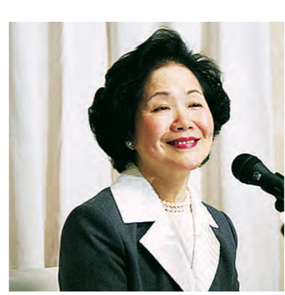
陳方安生將就民主之路發表演說。

【明報專訊】香港前政務司長陳方安生應菲沙研究院之邀，將在本月18日在溫哥華發表專題演講。香港回歸中國快將10年，菲沙研究院將在本月18日邀請陳方安生發表專題演講——「Hong Kong 10 Years Out——經濟、自由與邁向民主之路」。