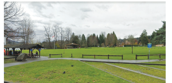
周一晚上，超過150名醉酒青少年在滿地寶市（Port Moody）的公園 Rocky Point Park 開狂歡派對。

警方提醒家長，應該注意青春孩子暑假期間的活動和去向。因為，當天從這些孩子的表現，以及事後和家長的交談來看，警方認為，許多家長並不知道，孩子們參加了公園飲酒狂歡派對，也不清楚有非法行為的發生。據悉，警方不建議對公園內的任何人提出指控。