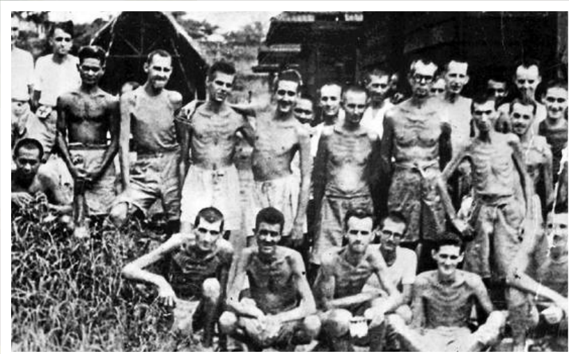
▲被日軍俘虜的加拿大軍人。

1938年：議員動議，促請聯邦政府廢止與日本簽訂的日本移民條約。同時把省議會中，提出反對日本人與華人入境卑詩省的意見，載入記錄。動議通過。