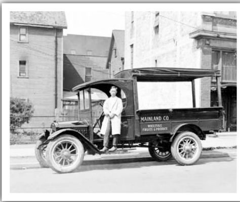
▲1926年的華人果菜批發商。

1934年 | 卑詩海岸蔬菜銷售局（BC Coast Vegetable Marketing Board）成立，目的是限制華人經營的果菜農場進一步擴大市場佔有率，令矛盾進一步激化。警察也插手，鎮守各運輸