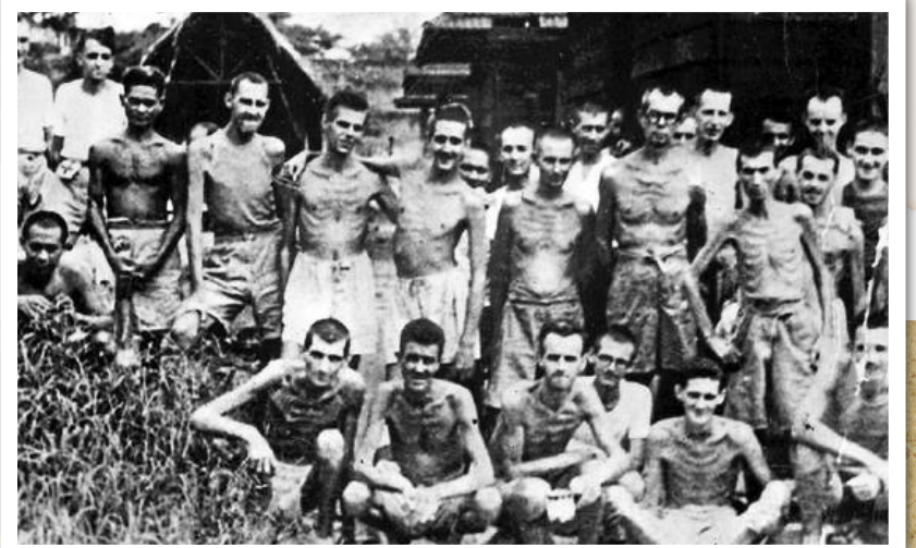
▲被日軍俘虜的加拿大軍人。

1938年：議員動議，促請聯邦政府廢止與日本簽訂的日本移民條約。同時把省議會中，提出反對日本人與華人入境卑詩省的意見，載入記錄。動議通過。