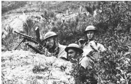
參與香港保衛戰的加軍。