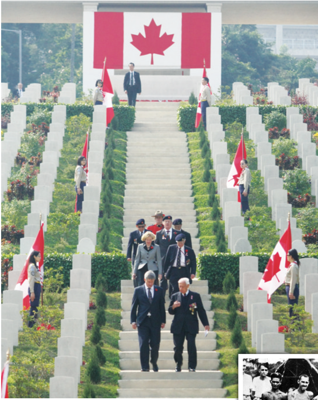
▲2012年，總理哈珀訪問香港時，特別前往港島的小西灣軍人墳場，向在二戰中保衛香港而犧牲的加拿大軍人致敬。

在同仇敵愾的氛圍下，加拿大民眾對華人維權活動也開始作出讓步。各級政府紛紛更改法律，恢復華人的合理合法權益。1947年，《排華法》被廢除，當時距離「香港保衛戰」只有六年。1949年，華人終於可以在省選與聯邦選舉中行使公民權利，投下神聖一票。在不到十年的時間之內，加國華人由沒有合法權利、身分曖昧的二等公民搖身一變成爲加拿大公民。