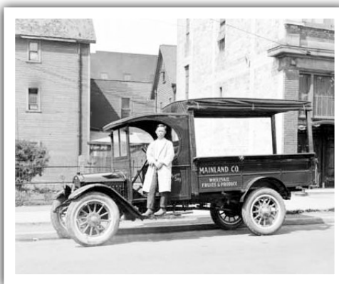
▲1926年的華人果菜批發商。

1934年 | 卑詩海岸蔬菜銷售局 (BC Coast Vegetable Marketing Board) 成立，目的是限制華人經營的果菜農場進一步擴大市場佔有率，令矛盾進一步激化。警察也插手，鎮守各運輸