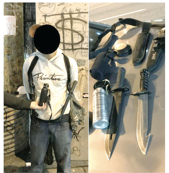
市警最近在公園一帶搜出的武器。(溫市警)

艾迪森表示警方絕不是在暗示公園裏的居民是犯罪分子。但不幸的是，部分犯罪分子已經潛入了該地區，並正在「捕食」這些弱勢羣體。