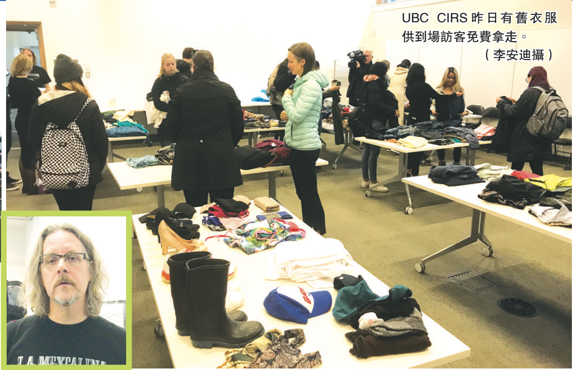
UBC CIRS 昨日有舊衣服供到場訪客免費拿走。

Herron 指，可持續時尚周的活動還包括了於周一舉行，有關經營可持續發展和道德的時尚品牌的研討會，以及周二有關時裝代價的記錄片《The True Cost》的放映會。