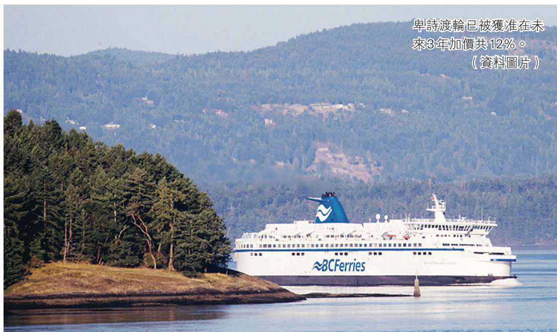
卑詩渡輪已被獲准在未來3年加價共12%。 (資料圖片)

【明報專訊】卑詩渡輪公司 (BC Ferries) 已獲准在未來3年，分3次加價共12%，渡輪票價最早於明年4月1日加價4.1%。卑詩渡輪專員在核准渡輪加價時，亦要求該公司必須提升效率，採取裁減服務等措施，減少5,400萬元的支出。