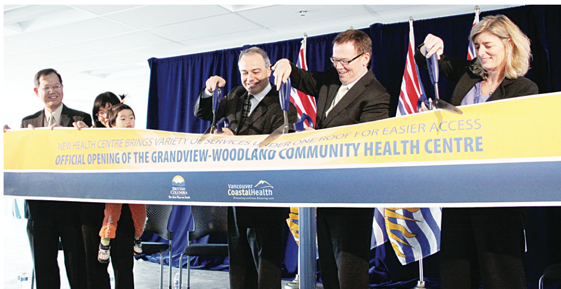
馮宜幹（右二）和艾肯胡森（右）一起為醫療中心剪綵。

卑詩衛生服務廳長馮宜幹（Kevin Falcon）在啓用儀式上稱，該間醫療中心將家庭醫生、牙醫、精神病、戒毒以及語言治療等13個部門集中在一起，將使民衆看診時更加便利；並且中心內的各項服務都會盡量做到低價或免費，還將推出各種計劃與活動，譬如慢性疾病的防治宣傳等，增加醫療機構與社區間的互動。