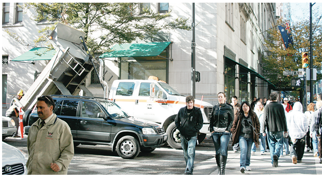
漢比街單車道開始施工，對附近交通造成影響。