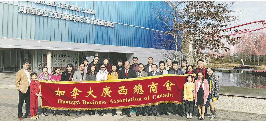
廣西總商會錄製節目推廣「三月三歌舞文化節」，圖為參加錄製節目的嘉賓。