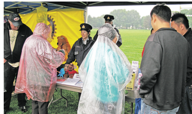
騎警攤位引起不少市民的興趣。

列治文消防局則將大型消防車開到現場，供市民參觀了解消防員的工作。列治文皇家騎警也在場擺有招聘及相關警務的攤位，並安排中文翻譯，吸引大批市民前來詢問並索取相關資料。