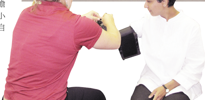
◀統計局人員在移動診所內示範部分測試。

健康統計，估計高達88%的人會同意提供數據。她指統計局等於是幫參加者進行詳細健康檢查，還會在診所內安排中文翻譯，更保證隱私不會外洩，華裔新移民絕對會願意配合。