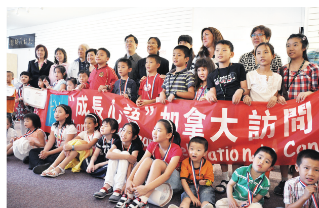
「成長心語」中加兒童日記畫展覽的小朋友和嘉賓們。