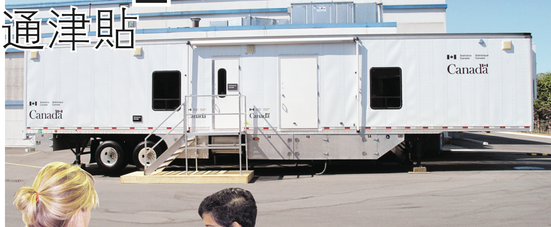
▲停放在列治文冰壺俱樂部外的移動診所。