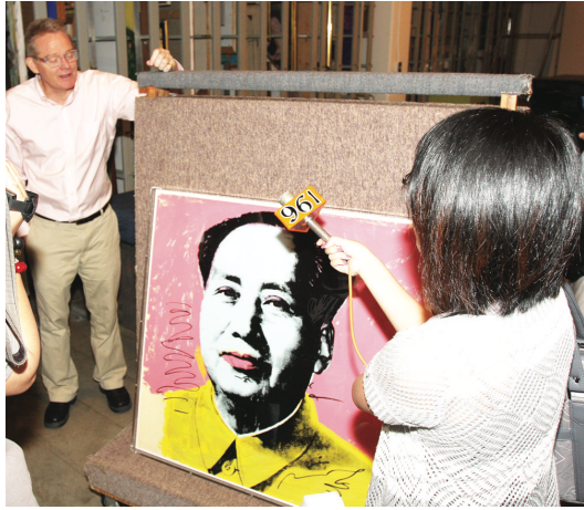
溫哥華美術館的珍藏之一：名畫家 Andy Warhol 的毛澤東像。

【明報專訊】溫哥華美術館 (Vancouver Art Gallery) 籌劃搬遷，擴大展出能力，有待市議會批准，美術館昨特別招待華裔社群領袖及華文媒體參觀，爭取華裔社群支持。