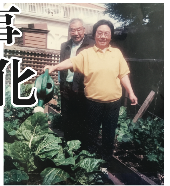
團隊一位採訪對象的祖母，在90年代與他們已故的祖父一起照料她的花園。