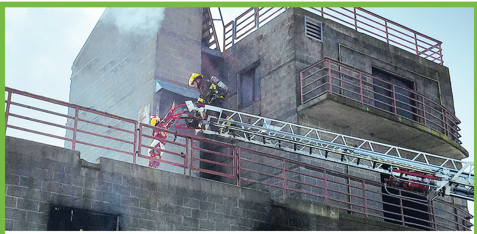
學生用雲梯救助被困人員脫離火災現場。

協議本身並不具約束力。他認為，省府並不會在該問題上施加壓力，省府的主要責任是交通，省府不會在沒有其他替代方案前關閉獅門橋道路。 溫市政府也指出，在2000年協議簽署時可能會在布勒內灣興建第三座橋，但是新建橋的計劃從來沒有實現。