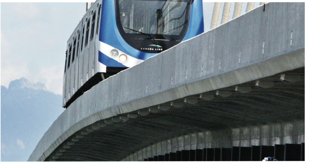
大溫改善交通運輸稅選票將於下周起寄出，選民填妥後須於 5 月底前寄回。