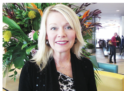
聯邦社會發展國務部長伯根。

伯根並會在下周，宣布一項改善殘障兒童設施的撥款計劃，期望能助有需要的機構改善設施。