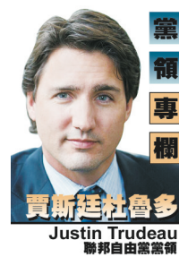
賈斯廷杜魯多 聯邦自由黨黨領

加拿大是一個熱情、友愛、和平、公平、公義的民主法治國家，這絕不會因任何威脅而改變。穆斯林社區的朋友們，加拿大民衆了解最近發生的以伊斯蘭名義的恐怖襲擊，與你們的信仰背道而馳。一如既往地相互合作與尊重，將有助防止偽裝成宗教的極端思想宣傳帶來的負面影響。我們要