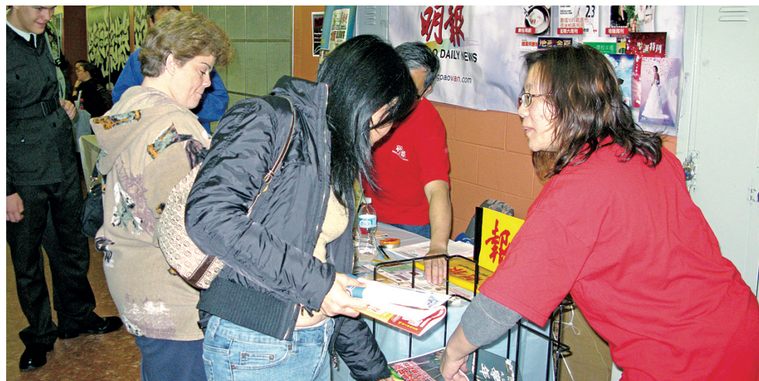
不少到本報攤位參觀的新移民，都認為本報刊物是協助他們了解加國人情與國情的重要渠道。

另外，主辦單位還安排了多個不同語言的講座，議題包括教育資訊、社區服務、醫療衛生、法律援助及社會福利等，十分廣泛。大會最後並安排了多場精彩的多元文化歌舞表演，讓到場的400多名新移民家庭成員度過了一個資訊與娛樂兼備的上午。