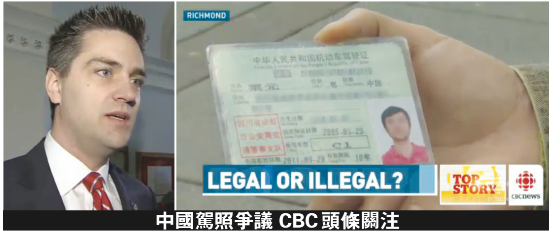
中國駕照爭議 CBC 頭條關注

【明報專訊】中國駕照不被列治文皇家騎警 (RCMP) 承認的問題到昨日仍是無解，此事並引起主流電視台關注，CBC 電視台昨日即以頭條新聞處理有關爭議。卑詩省運輸廳長斯頓 (Todd Stone) 昨日被 CBC 電視台追問時，只答說「我不具體描繪有關爭議的問題是什麼」，但「會確定在卑詩省開車的人士，擁有適當且合法的證件」。有中國留學生認為，斯頓的答覆缺乏明確，令她擔心中國駕照在列治文不被警察承認，可能會收罰單。