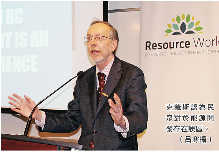
克羅斯認為民眾對於能源開發存在誤區。