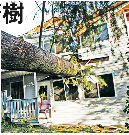
若溫市保護樹木的修例獲通過，只有構成危險或枯萎的有問題樹木才可砍掉。(資料圖片)

建議的修例只准許砍掉有問題，如有病、將枯萎和構成危險的樹木，有關建議最快下周投票決