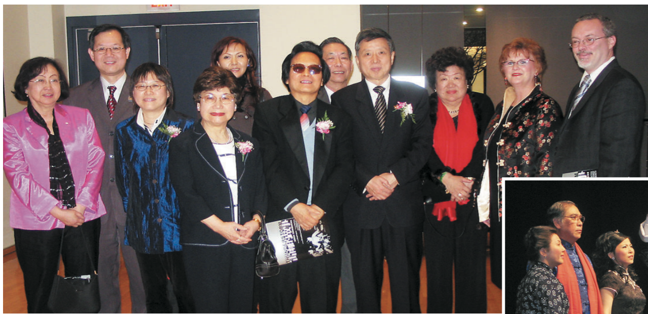
▲「雷雨的故事」歌劇詠嘆調音樂會昨晚舉行，獲不少本省社區名人捧場，圖為來賓合影。前排右4為中國駐溫哥華總領事楊強，右5為作曲家唐康年。