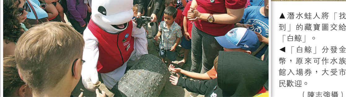
▲潛水蛙人將「找到」的藏寶圖交給「白鯨」。 ▲「白鯨」分發金幣，原來可作水族館入場券，大受市民歡迎。