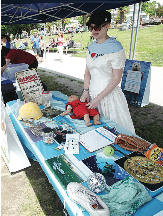
▲海中找到的垃圾陳列在一起，包括工作人員身上穿著的婚紗。

溫哥華水族館將在6月使用新入口及開放5.5萬平方呎的場地，並會在6月19日晚上舉行盛大派對，加以慶祝。