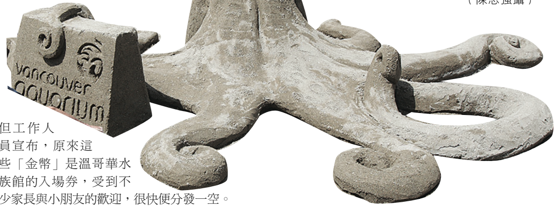
▲水族館特別僱人製作的八爪魚沙雕。

溫哥華水族館將在6月使用新入口及開放5.5萬平方呎的場地，並會在6月19日晚上舉行盛大派對，加以慶祝。