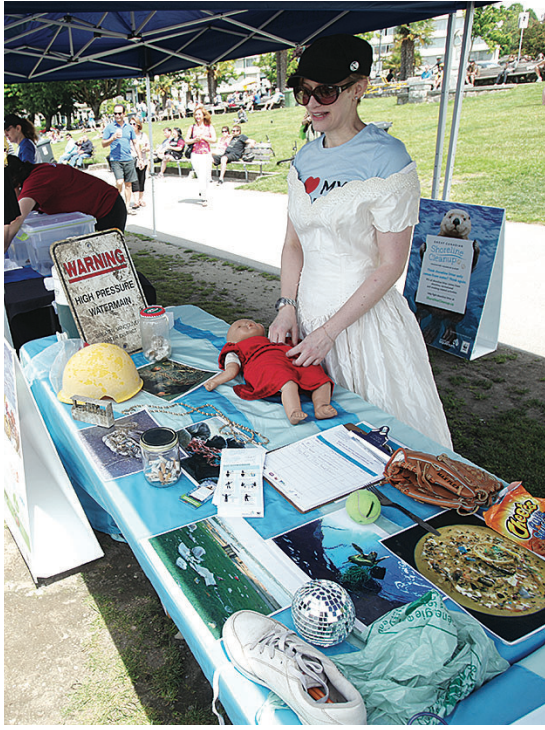
▲海中找到的垃圾陳列在一起，包括工作人員身上穿著的婚紗。

溫哥華水族館將在6月使用新入口及開放5.5萬平方呎的場地，並會在6月19日晚上舉行盛大派對，加以慶祝。