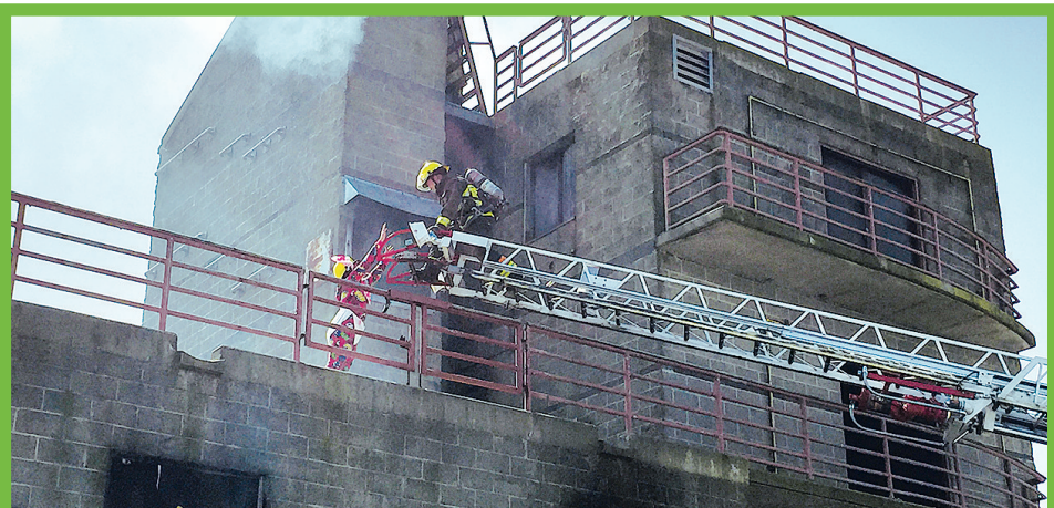
學生用雲梯救助被困人員脫離火災現場。

協議本身並不具約束力。他認為，省府並不會在該問題上施加壓力，省府的主要責任是交通，省府不會在沒有其他替代方案前關閉獅門橋道路。 溫市政府也指出，在2000年協議簽署時可能會在布勒內灣興建第三座橋，但是新建橋的計劃從來沒有實現。